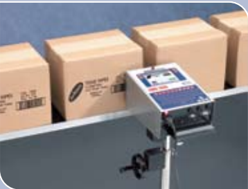
Quattro installed on conveyor